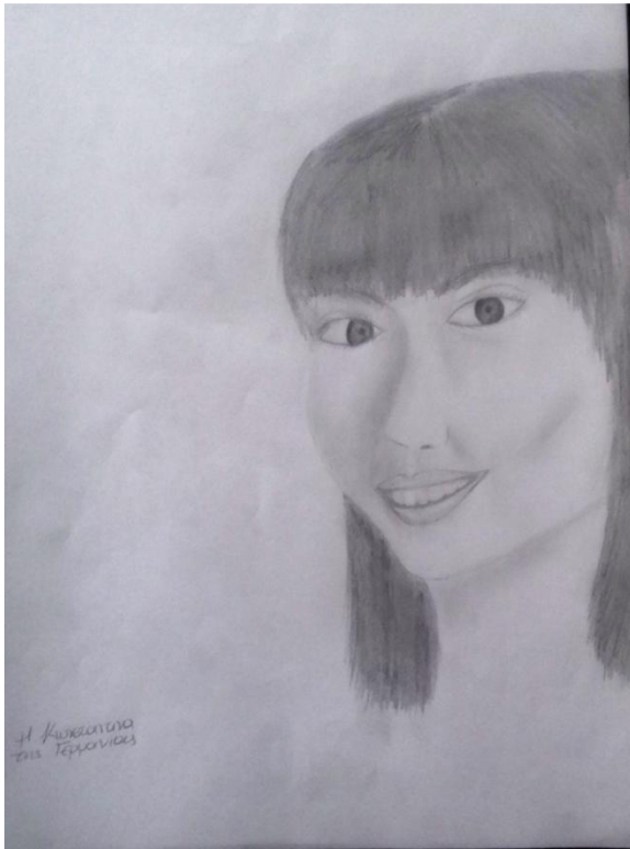
Η Κωνσταντίνα της Γερμανίας