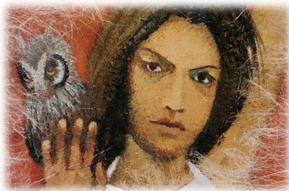
Εξώφυλλο από το βιβλίο της ΑΛΚΗΣ ΖΕΗ: Η Κωνσταντίνα και οι αράχνες της Εκδόσεις ΚΕΔΡΟΣ

ΟΜΑΔΑ ΦΙΛΑΝΑΓΝΩΣΙΑΣ – ΣΧΟΛ. ΕΤΟΣ 2016 - 17